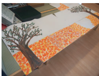
製作途中のちぎり絵